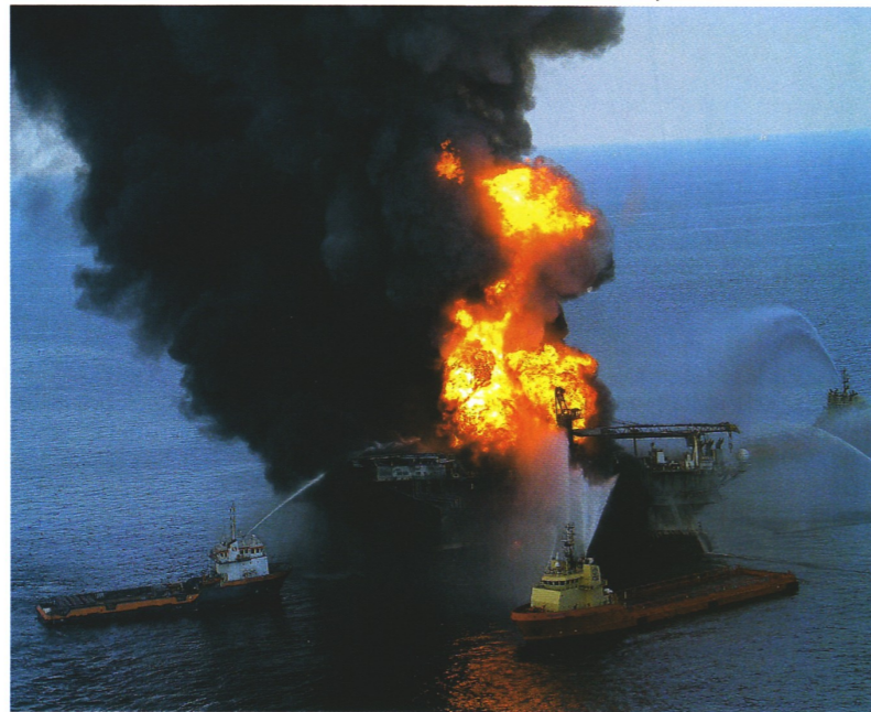
La piattaforma Deepwater Horizon esplosa lo scorso 20 aprile nel Golfo del Messico

La gravità della situazione impone una riflessione sui limiti della tecnologia. In que-