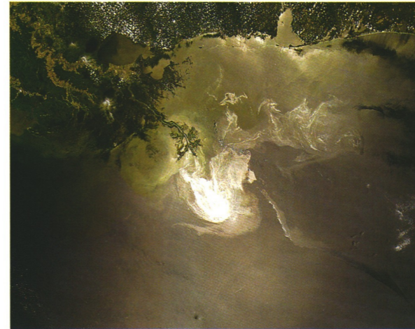
L'incidente ripreso dal satellite